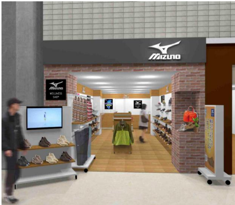
「ミズノウエルネスショップ鹿児島」※画像はイメージです。

http://www.city.kagoshima.lg.jp/_1010/shimin/7siseijouhou/7-15tokei/7-15-3/7-15-3-1/7-15-3-1-14.html