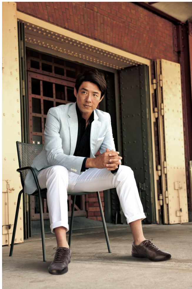
『カジュアルな服装にもピッタリだ!』 ミズノ・ブランドアンバサダー松岡修造

長距離用のウォーキングシューズにも採用されている、「スムーズライド」を搭載。強い蹴り出しを実現し、着地した力をそのまま前へ伝える設計で、足が自然と前に前に進むような、軽やかな足運びをサポートします。