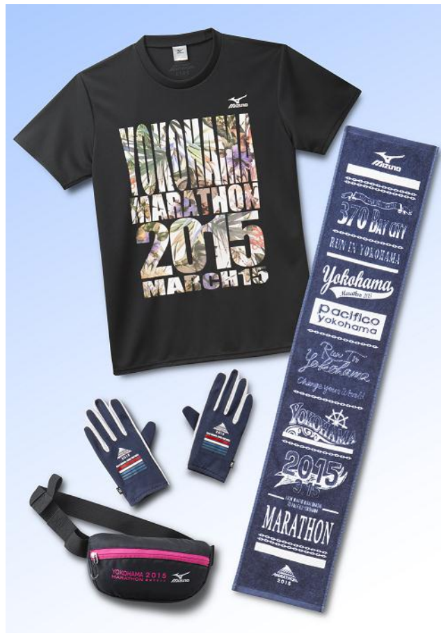
「横浜マラソン 2015」大会記念品