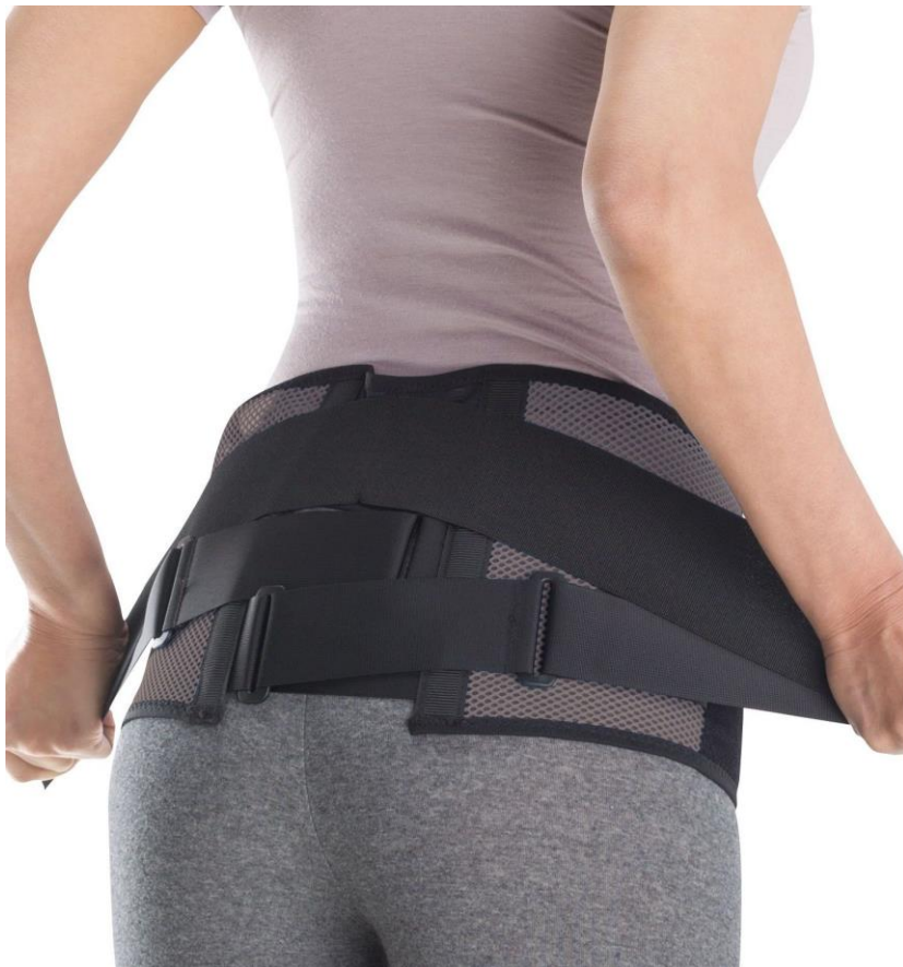
腰部骨盤ベルト ワイドタイプ:¥8,800+税 (税込み価格¥9,504)