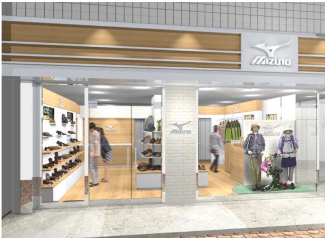
「ミズノ広島立町店」※画像はイメージです。