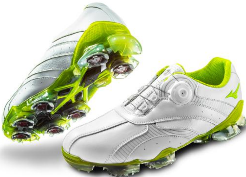
「VALOUR 001 Boa」

オープン価格（予想店頭価格 ¥18,500 前後＋税（参考：税込価格 ¥19,980 前後））