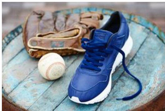
「ミズノスポーツスタイル」シューズ 「MIZUNO GV87 オールレザーモデル」

今回発売するシューズには復刻モデルだけではなく、今春にアッパー（甲の部分）全体に牛革を使用したオールレザーモデルの展開を予定するなど、新たな商品も含んでいます。