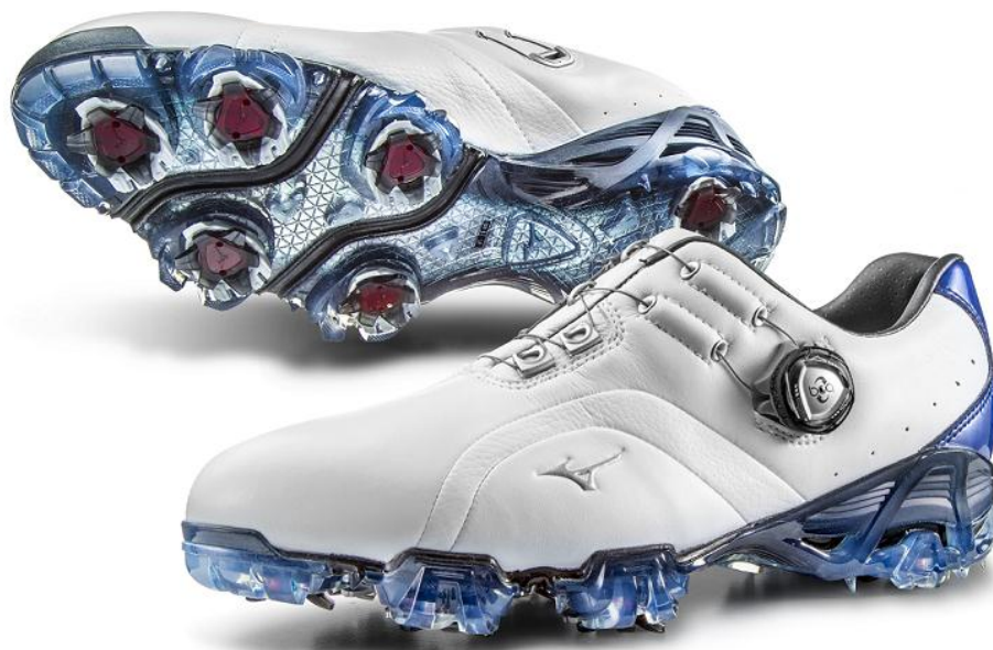
「GENEM 006 Boa」

オープン価格（予想店頭価格 ¥25,000 前後＋税（参考：税込価格 ¥27,000 前後））