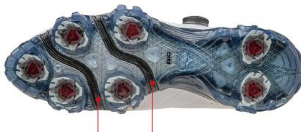
D-フレックスグループ

アウトソールを左右に横断する形で大きな屈曲溝を入れた「D-フレックスグループ構造」を採用し、縦方向に加え横方向の屈曲性も高めています。スイング中の足の動きに追従して変形することで、力が地面にダイレクトに伝わり、安定したスイング動作をサポートします。