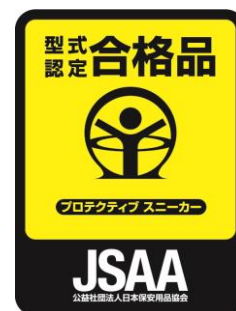
型式認定合格品タグ

JSAA 制定のプロテクティブスニーカー規格に基づき性能試験（つま先部の耐圧迫性・耐衝撃性 表底のはく離抵抗）を行っています。この試験をクリアした製品に「型式認定合格」を付与しています。プロテクティブスニーカー規格を満たしたシューズには、公益社団法人日本保安用品協会（JSAA）の型式認定合格品タグが付いています。