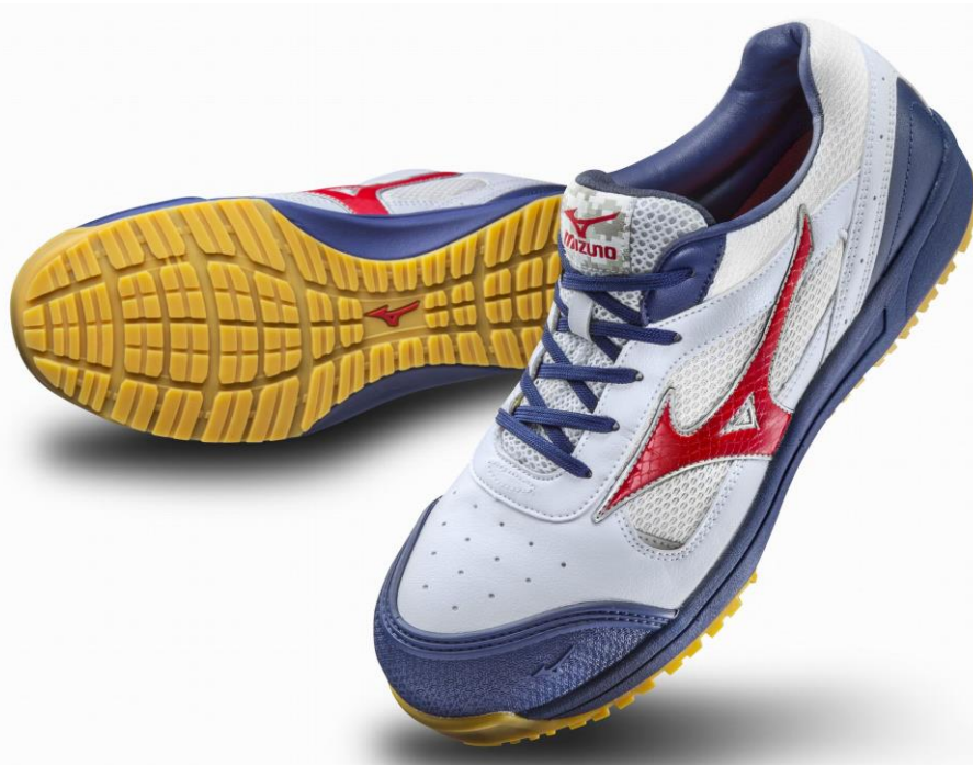
ワーキングシューズ「オールマイティ」

オープン価格（予想店頭価格 ¥9,000 前後＋税（参考：税込価格 ¥9,720 前後）