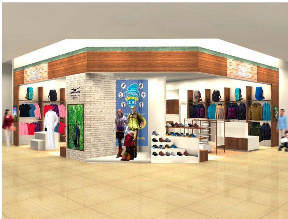
「ミズノウエルネスショップあまがさきキューズモール店」 ※画像はイメージです。