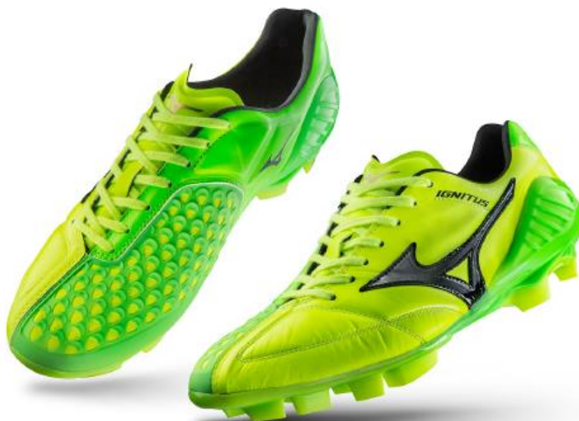
「WAVE IGNITUS 4 JAPAN」

『代表戦の中で心に残っている大会のひとつである2010年の南アフリカ大会。この大会でイエローのシューズを使用していました。自分にとってイエローはとてもイメージがいいので、今回のシューズで前回の代表戦を上回る活躍、成績を残したいです。』