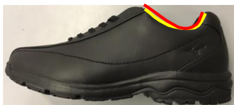
② くるぶしに当たりにくい縁